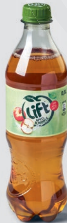
Lift Apple Spritzer