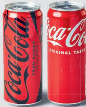
Coca-Cola/ Coca-Cola Zero