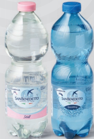
San Benedetto Sparkling/Still Water

Preis pro l / Price per l: 6,40 € 500 ml