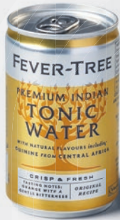
Fever-Tree Premium Indian Tonic Water