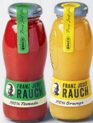
Rauch Orange/Tomato Juice