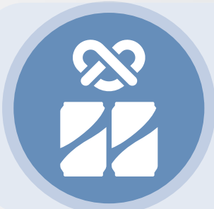
Spezi Duo 2x Krombacher Spezi + Olly's Pretzels